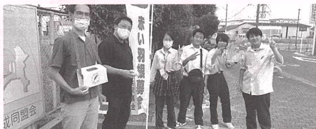
寒川駅前にて、街頭募金活動の様子